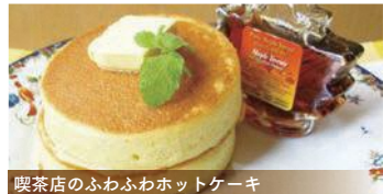
喫茶店のふわふわホットケーキ