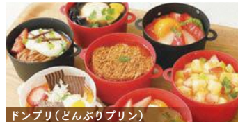
ドンブリ(どんぶりプリン)