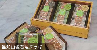
福知山城石垣クッキー