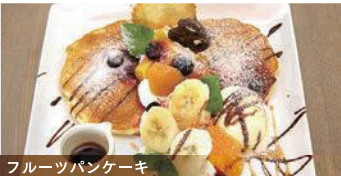
フルーツパンケーキ