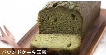
パウンドケーキ玉露