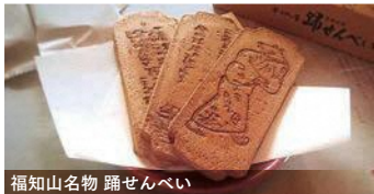
福知山名物 踏せんべい

創業大正9年、福知山名物「踏せんべい」。福知山 音頭の調べを1枚のおせんべいに焼き上げました。