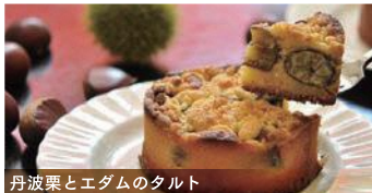
丹波栗とエダムのタルト