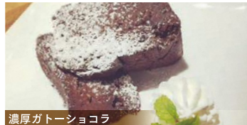
濃厚ガトーショコラ