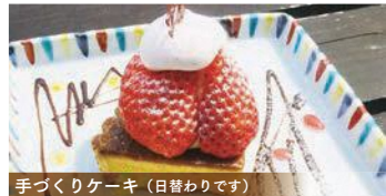
手づくりケーキ (日替わりです)

〒福知山市駅前町36 ☎0773-22-2765 🕒 10:00～18:00 📅 日曜