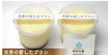
光秀の愛したプリン