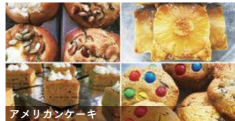
アメリカンケーキ

アメリカン & ブリティッシュスタイルのケー キ、マフィン、焼菓子等を製造しています。