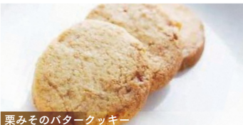
栗みそのバタークッキー

1年熟成された栗味噌を使用したクッキーをご賞味ください。 ※「ふくやま 丹波のスイーツアイデアコンテスト」審査員特別賞受賞作品