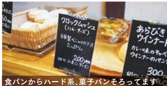
食パンからハード系、菓子パンをそろえます