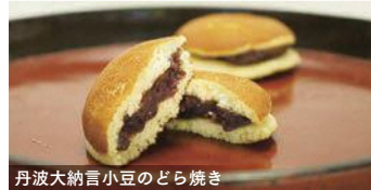
丹波大納言小豆のどら焼き