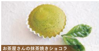
お茶屋さんの抹茶焼きショコラ