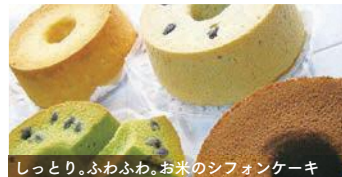
しっとり。ふわふわ。お米のシフォンケーキ