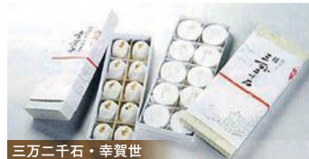
三万二千石・幸實世